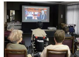
介護施設でのオンライン イベント運営