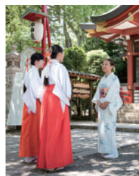
寺社仏閣での文化 宿泊体験の提供